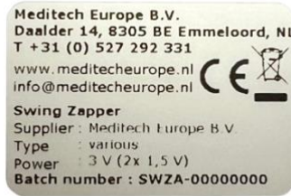
Şekil 4.2 Tip resmi