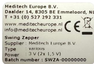
Εικ. 4.2 Πινακίδα τύπου