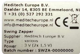
Fig. 4.2 Placa de características